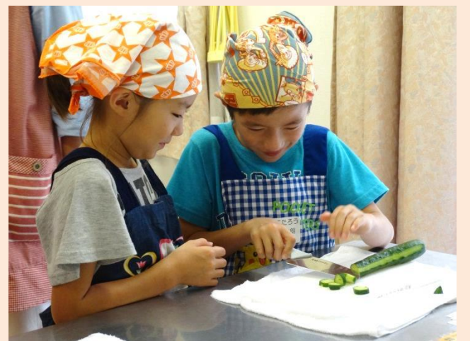
きゅうりはピーラーでしましまにします。