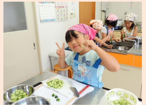
やったー！！とってもうすく切れたよ。げいじゅつ作品のきゅうりと記念写真☆