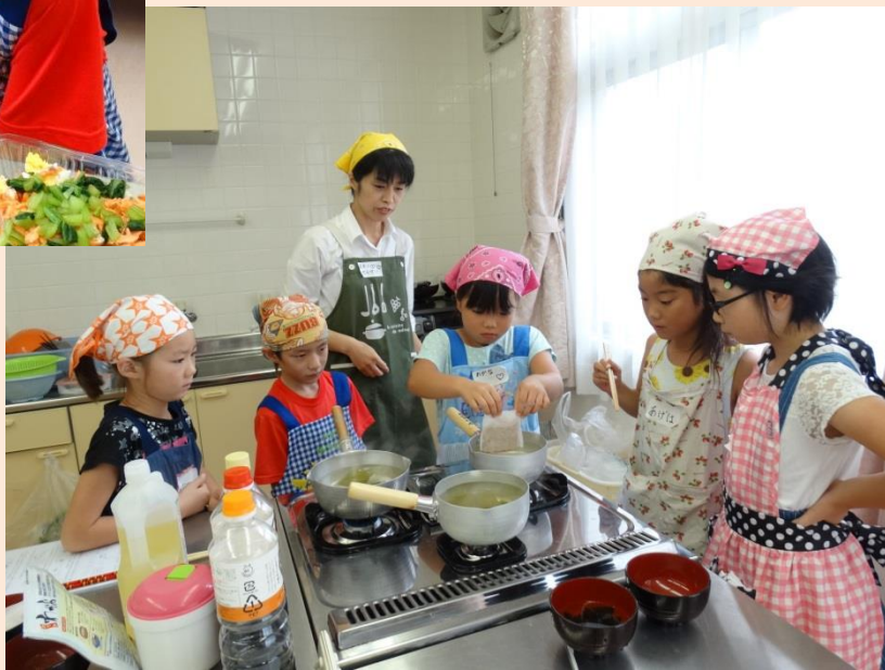
こんぶとかつおぶしでだしをとります。いいにおい！