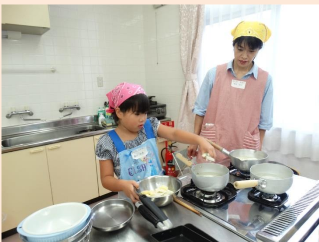
おみそ汁もにぼしでだしをとります。