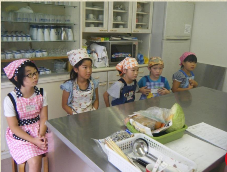
今回参加してくれたのはこの5人!