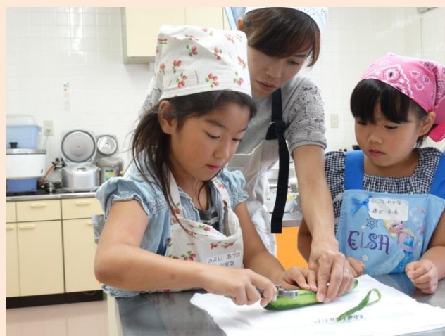
ピーラーも使いこなしています。