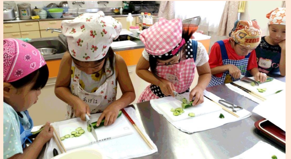
きゅうりのうす切りにちょうせん！みんな真剣です！