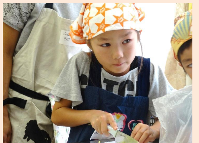
ねこの手も上手にできています!