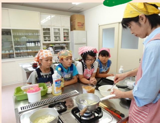
みんないっしょうけんめい聞いているね!