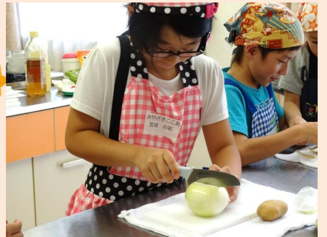
おみそ汁に入れるたまねぎを切ります。