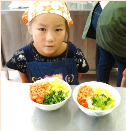
キレイにもりつけできました！