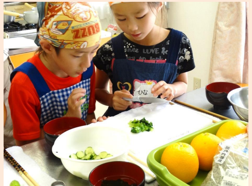
こまつなもこまかく切ります。包丁の使い方が上手！